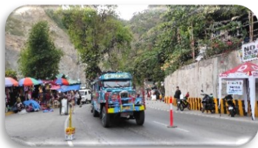
รถ Jeepney รถโดยสาร/รถสองแถวของฟิลิปปินส์บนเส้นทางเมืองบาเกีย