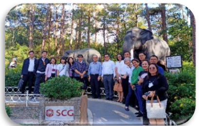
สวนสาธารณะเมืองบาเกีย

นอกจากนี้คณะกรรมการมูลนิธิฯ ยังได้แวะตลาดเทศบาลแห่งเมืองบาเกีย ซึ่งถือเป็นตลาดสดที่ใหญ่ที่สุดในเมืองบาเกีย จังหวัดเบงเกต เพื่อดูวิถีชีวิตการอยู่กินของผู้คนในเมืองบาเกีย โดยในตลาดนี้จะมีทั้งสินค้าที่เป็นวัตถุดิบ โดยแบ่งโซนร้านค้าออกเป็นลักษณะต่าง ๆ เช่น โซนปลา อาหารทะเล โซนเนื้อสัตว์ ผักผลไม้ ไปจนถึงโซนร้านขายของชำ เสื้อผ้า รองเท้า ของใช้ตลาดจน โซนสินค้าพื้นเมือง/ของที่ระลึกต่าง ๆ รวมถึงร้านสินค้ามือสอง โดยผู้ขายส่วนใหญ่เป็นชาวเมืองบาเกีย ส่วนผู้ซื้อทั้งชาวเมืองบาเกียและนักท่องเที่ยว ซึ่งถือว่าตลาดแห่งนี้นอกจากจะเป็นตลาดสดที่ใหญ่ที่สุดแล้ว ยังเป็นตลาดที่รวมพืชผักและผลไม้เมืองหนาว และอาหารสดที่มีราคาสำหรับคนท้องถิ่นสามารถจับจ่ายใช้สอยในชีวิตประจำวันได้